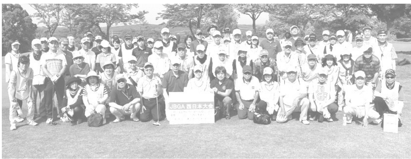
昨年5月に開催されたJBGA西日本大会(神戸パインウッズGC)に参加されたブラインドゴルファーとボランティアの皆さん