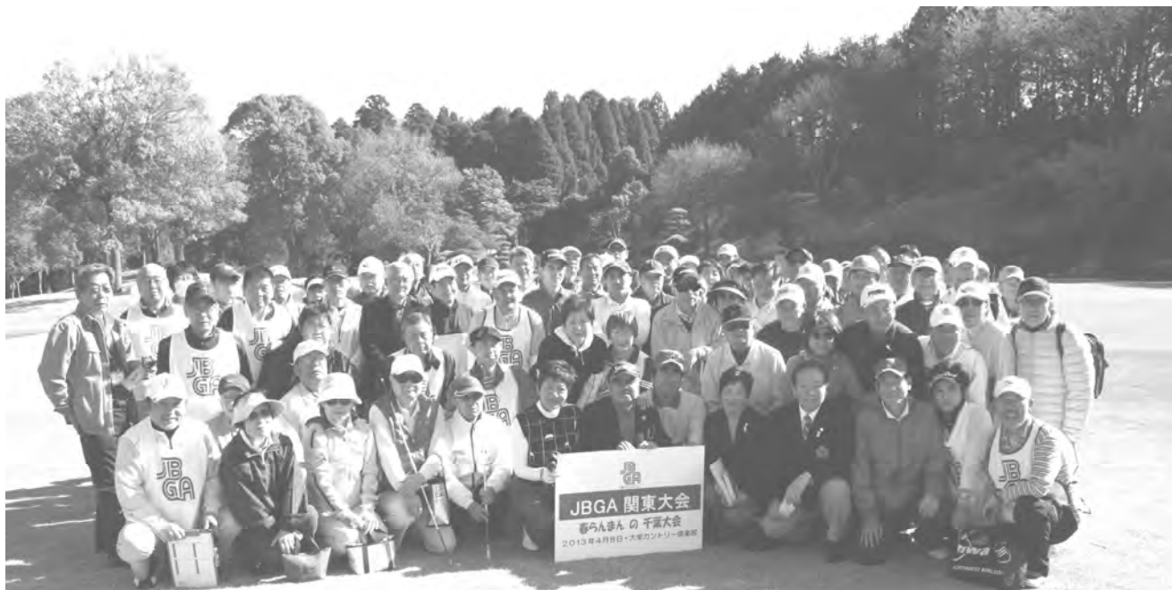
昨年4月のJBGA関東大会（千葉県・大栄CC）に参加されたブラインドゴルファーとボランティアの皆さん

JBGA 会員であればどちらにお住まいの方でもご参加できます。また、ガイドの方の交通費は、いつもどおりJBGAが援助させていただきます。