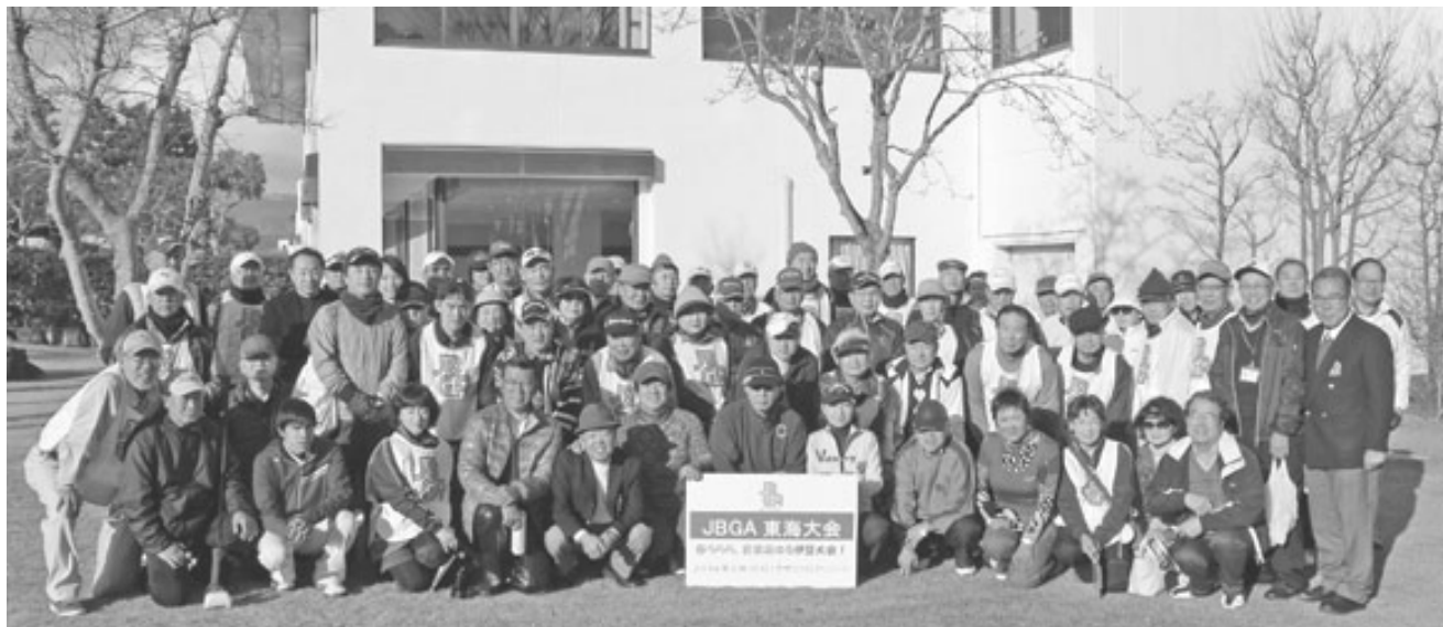
昨年の JBGA 東海大会 (静岡県サザンクロスリゾート) に参加されたブラインドゴルファーとボランティアの皆さん

JBGA 会員であればどちらにお住まいの方でもご参加頂け、ガイドの交通費はいつもどおり援助させていただきます。ふるってのご参加お待ちしております。