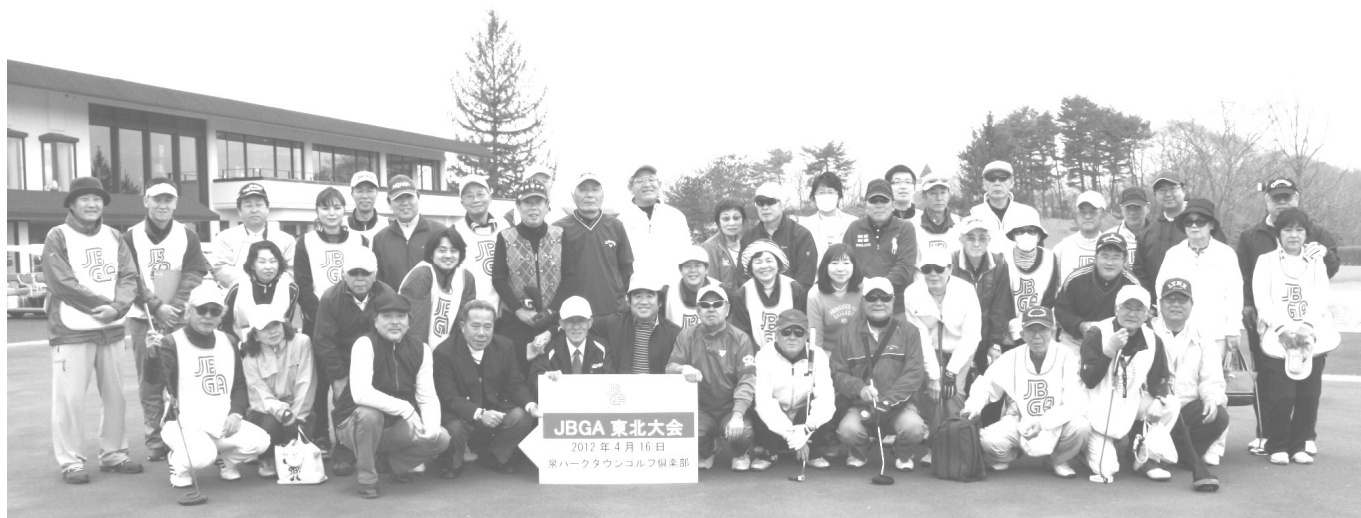
2012年4月のJBGA東北大会(仙台市・泉パークタウンGC)に参加されたブラインドゴルファーとボランティアの皆さん

皆様のご参加をお待ちしております。JBGA会員であればどなたでも参加でき、ガイドの方の交通費は、いつもどおりJBGAが援助させていただきます。