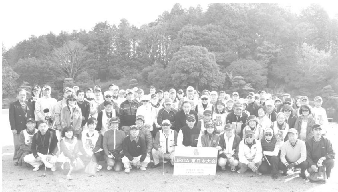
昨年11月のJBGA東日本大会(千葉県・大栄CC)に参加されたブラインドゴルファーとボランティアの皆さん

JBGA会員であればどちらにお住まいの方でもご参加できます。また、ガイドの方の交通費は、いつもどおりJBGAが援助させていただきます。