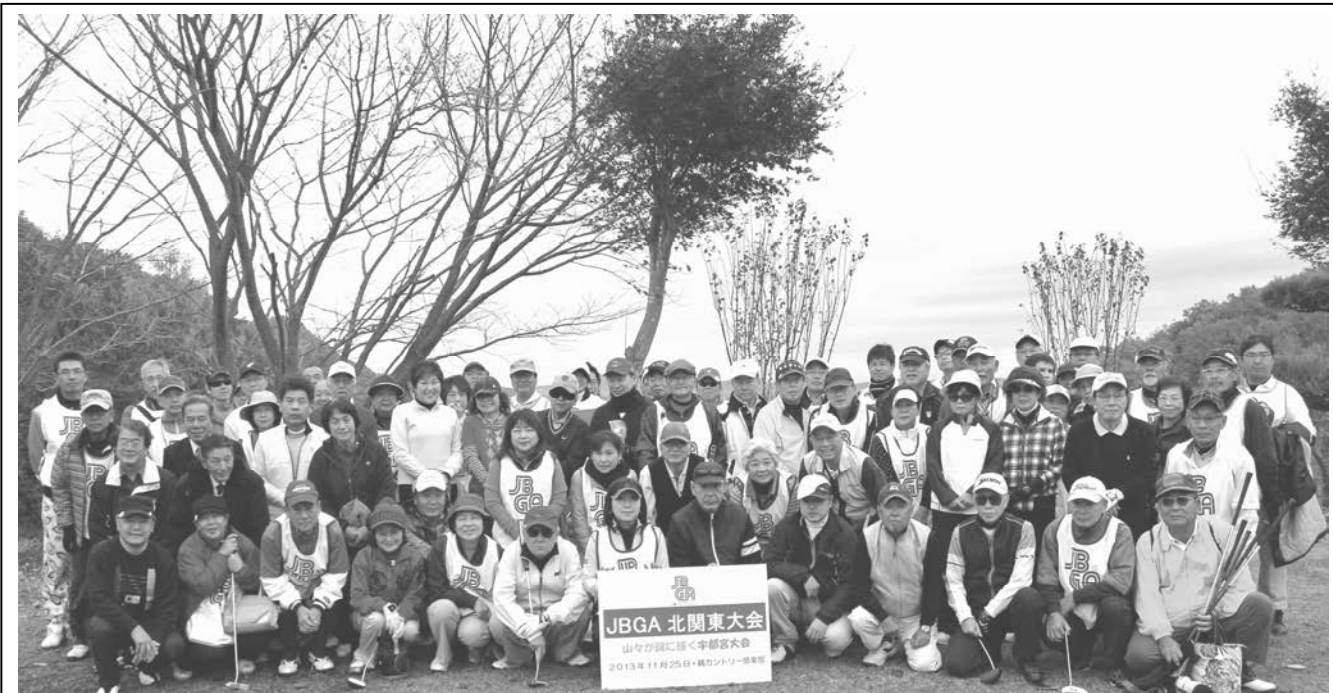
昨年11月のJBGA北関東大会(栃木県宇都宮市・鶴CC)に参加されたブラインドゴルファーとボランティアの皆さん

JBGA 会員であればどちらにお住まいの方でもご参加できます。また、ガイドの方の交通費は、いつもどおり JBGA が援助させていただきます。