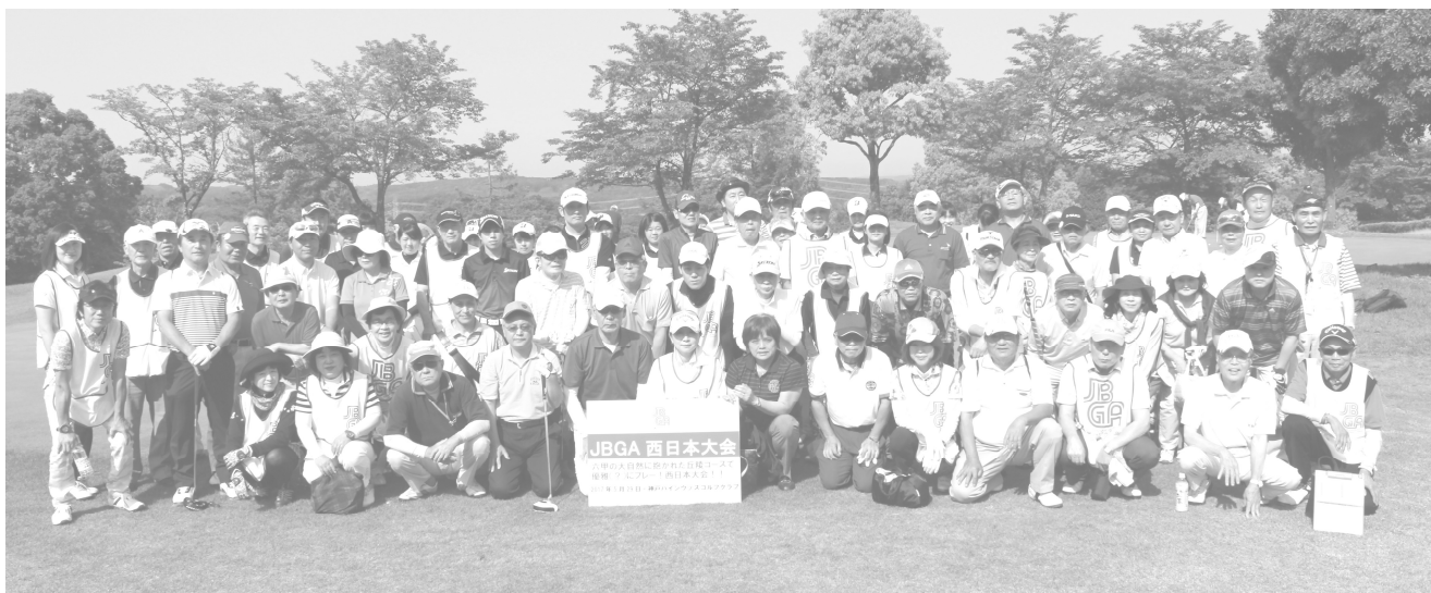
今年5月に開催された西日本大会(神戸パインウッズ GC)に参加されたブラインドゴルファーとボランティアの皆さん